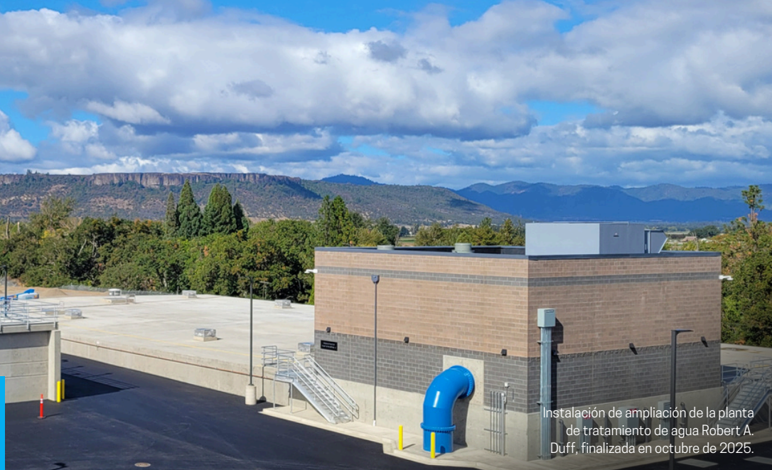
Instalación de ampliación de la planta de tratamiento de agua Robert A. Duff, finalizada en octubre de 2025.

Este trabajo continuo refleja nuestro compromiso de proporcionar agua potable fiable y de alta calidad, y nos posiciona para satisfacer las necesidades de agua del Valle de Rogue durante las próximas décadas.